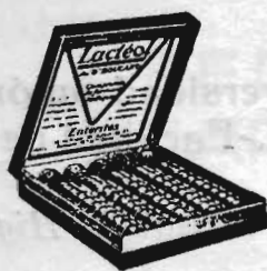
Lactéol del Dr BOUCARD Comprimidos de bacilos lácticos

El Lactéol del Dr BOUCARD (Comprimidos de bacilos lácticos) realiza una desinfección intestinal rápida. Enteritis, Diarreas, Infección y autointoxicación intestinal