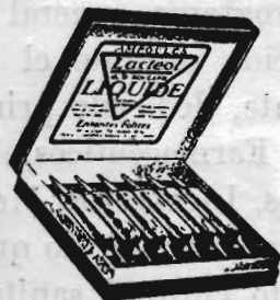
Lactéol-Líquido del Dr BOUCARD Ampollas de bacilos lácticos

9 a 12 comprimidos al día, desleídos en un poco de agua azucarada antes de las comidas